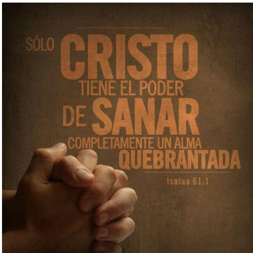
Imagen de la semana