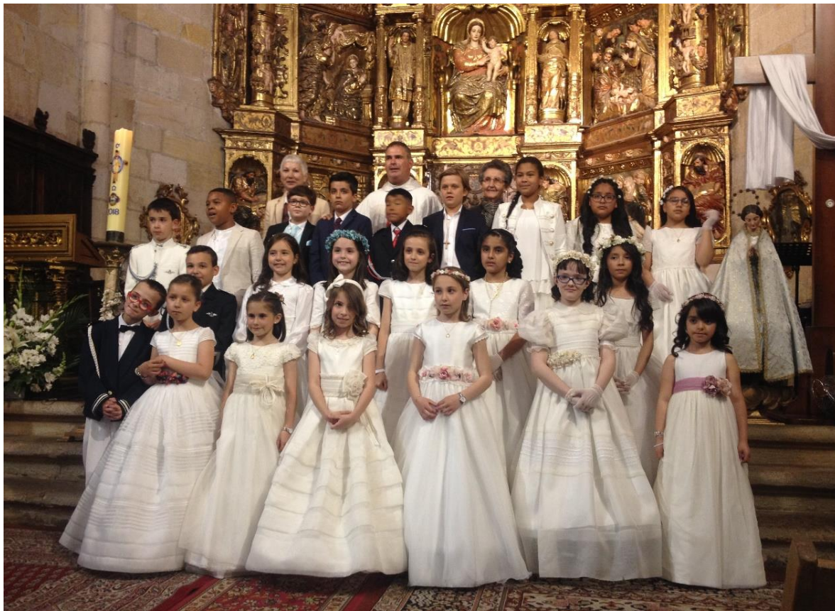
Imagen de la semana

El domingo 20 y el sábado 26 celebramos las Primeras Comuniones en nuestra Parroquia.